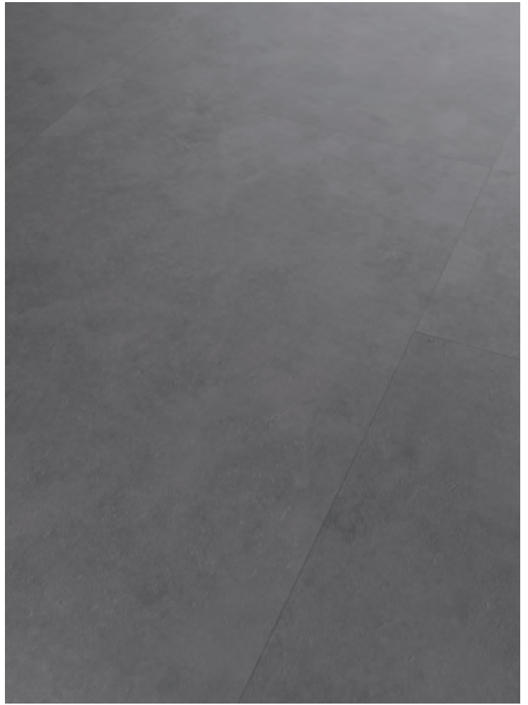
6. MARAGHA # MY03-18