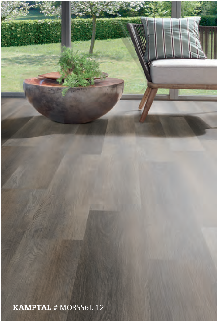
KAMPTAL # MO8556L-12