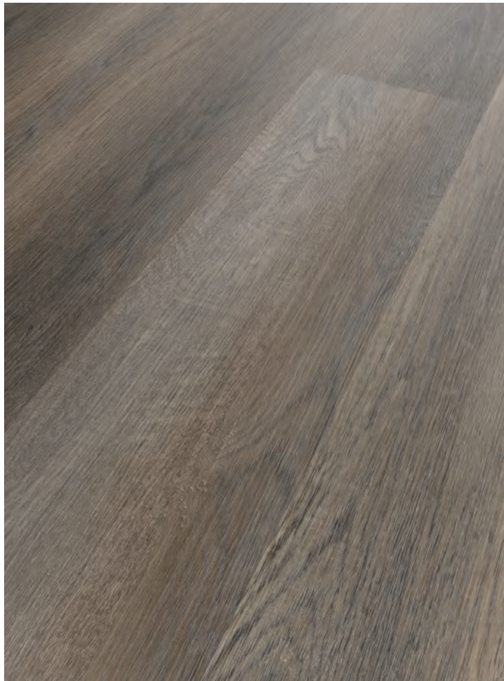
1. KAMPTAL # MO8556L-12