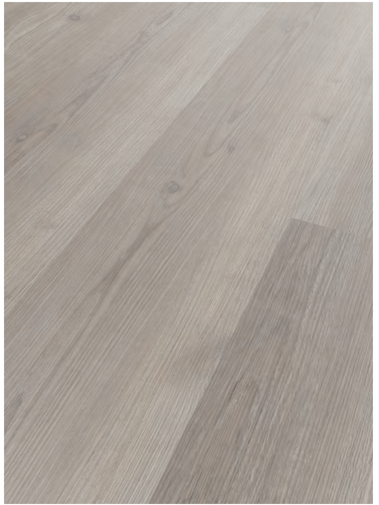
10. GRODA # MO8624L-2