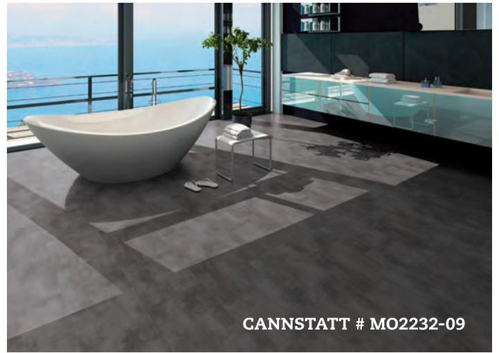
CANNSTATT # MO2232-09