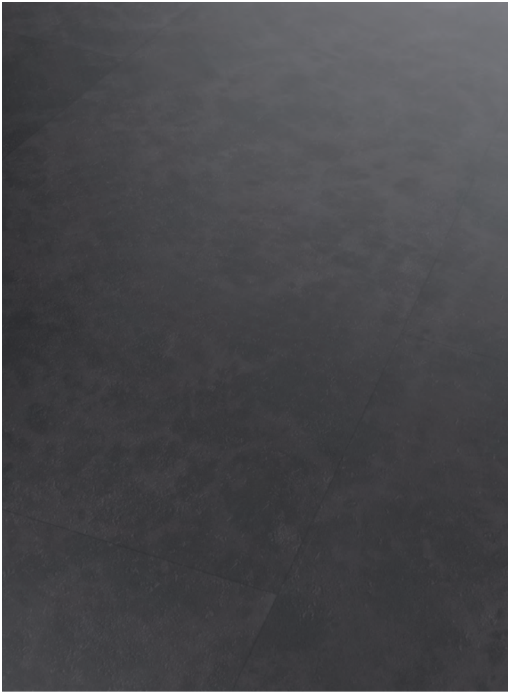
5. GERDOO # MJ8002-2