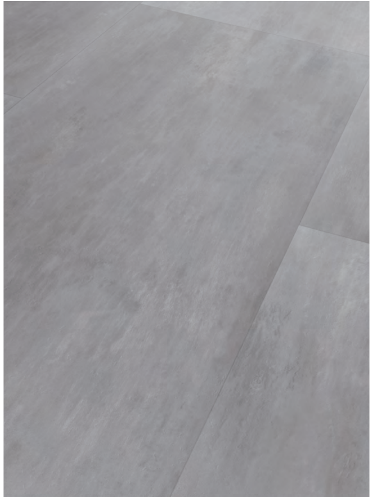
8. ROMANO # MO2213-06