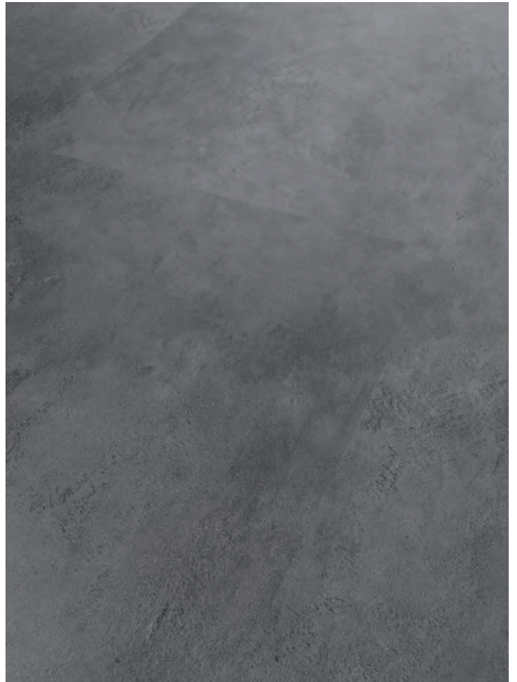
12. GANNSTATT # MO2232-09