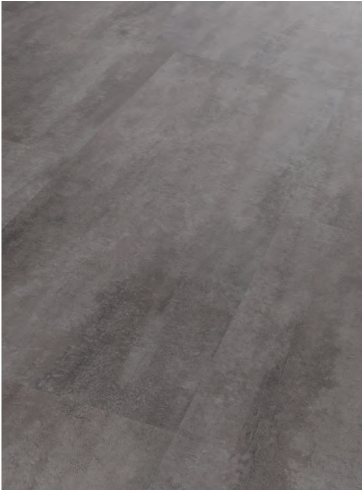
7. TOSCANO # MOA01204-03