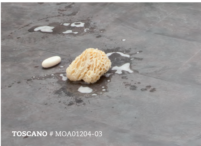
TOSCANO # MOA01204-03