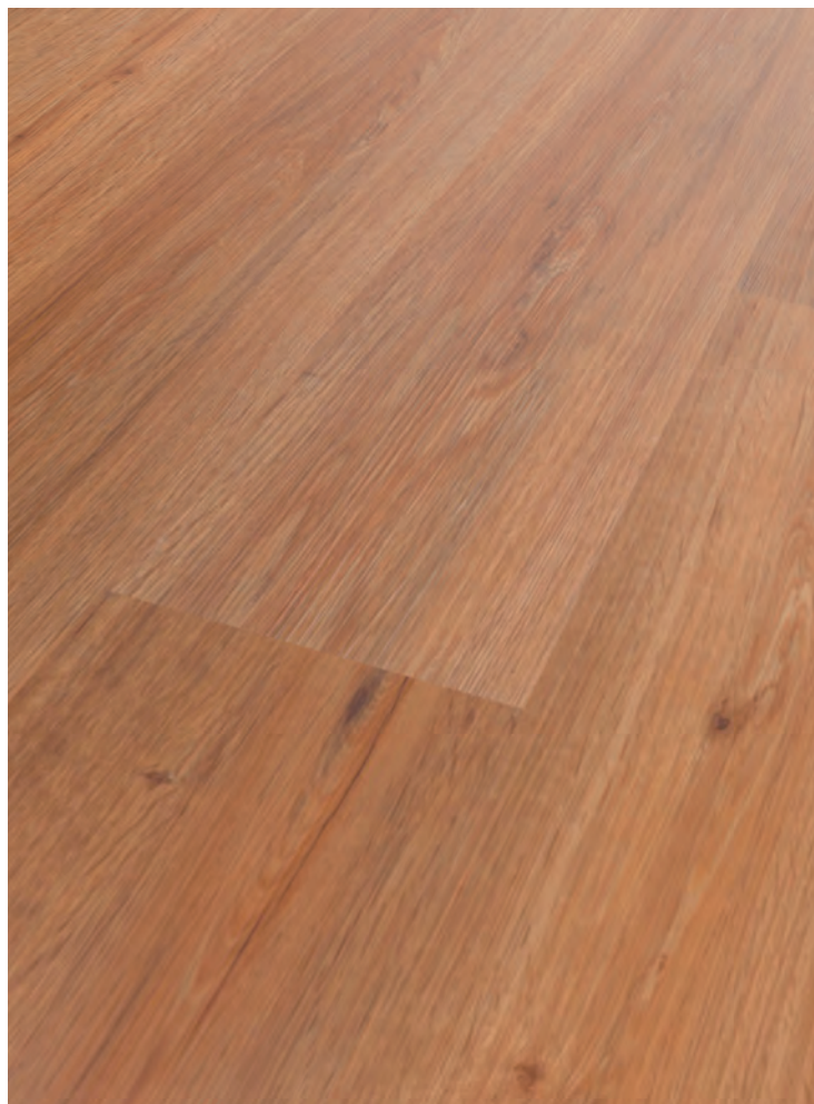
4. BUGURA # MB2210-18