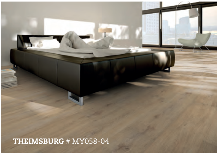
THEIMSBURG # MY058-04