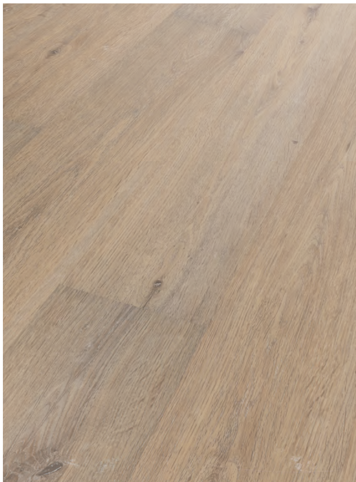
3. THIEMSBURG # MY058-04