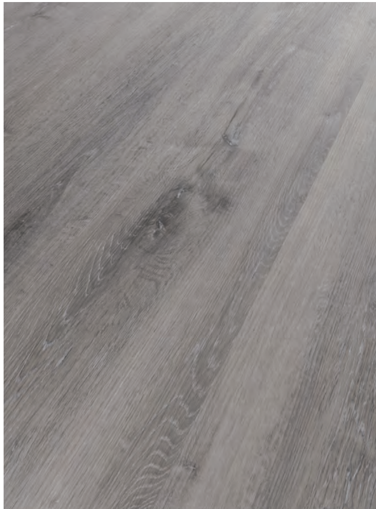
2. BÖDMEREN # MO625L-1