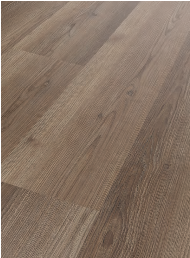
11. HAINICH # ORGW-624L-1