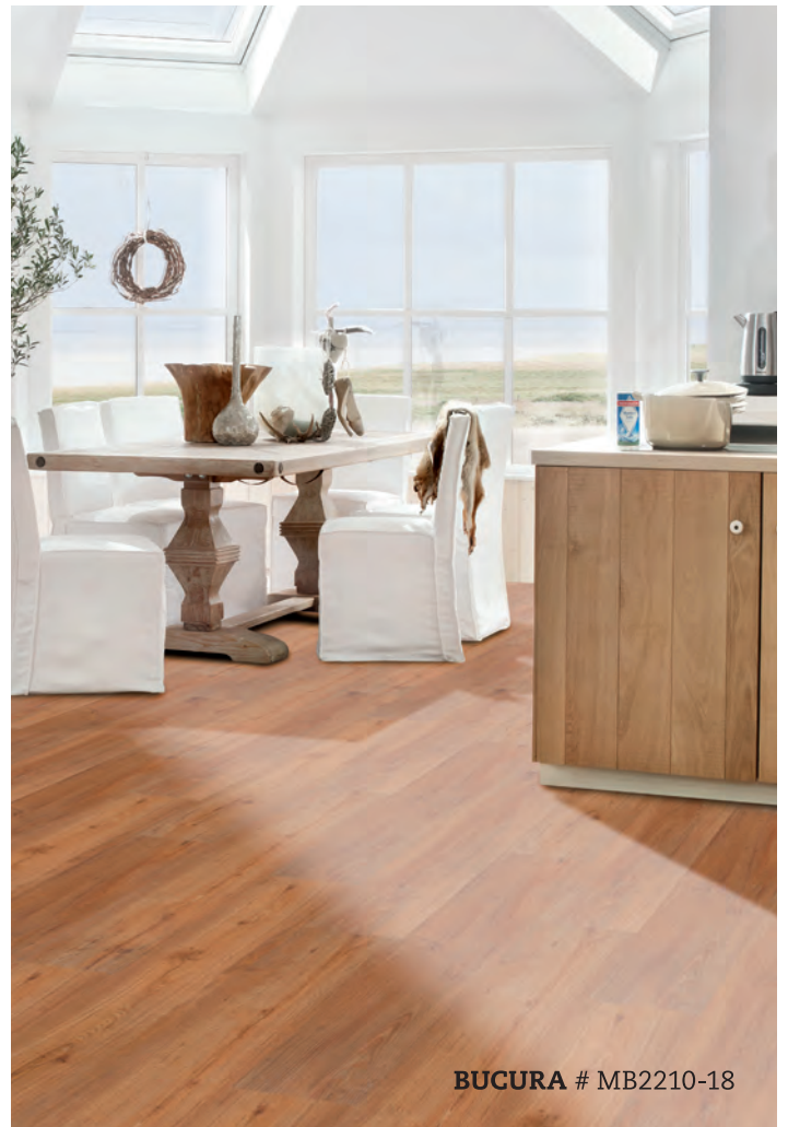
BUGURA # MB2210-18