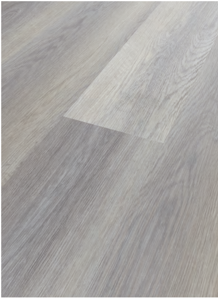
9. HEXENBERG # MO8556L-9