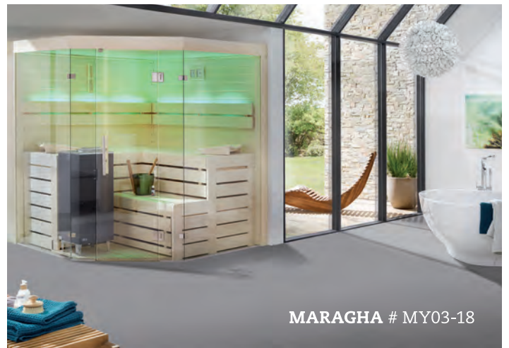
MARAGHA # MY03-18